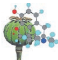
Morfina, a partir da cápsula da papoila: