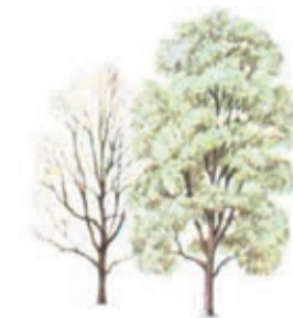
Casca do Salgueiro: